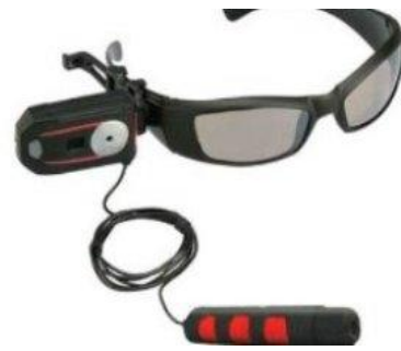
نظارة مزودة بجهاز تنصت صوت وصورة