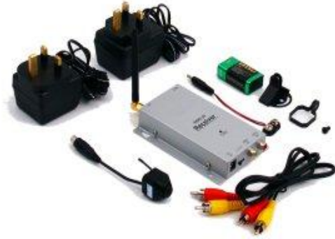
كاميرات فيديو لاسلكية لأغراض تجسسية-شكل (1)