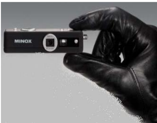
كاميرا مع جهاز أم بي