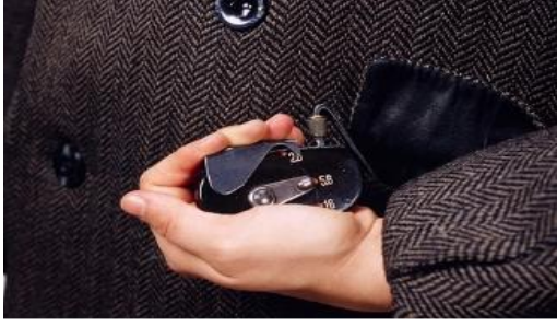
كاميرا مجهزة داخل معطف