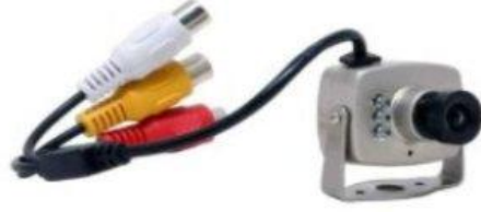
كاميرا تلفزيونية لأغراض مراقبة وتجسس