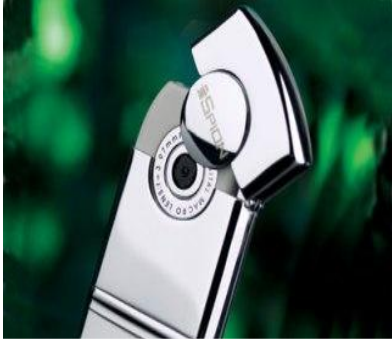
كاميرا في شكل ولاعة