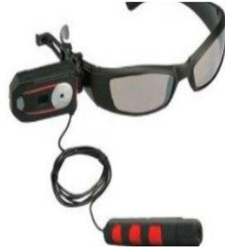
نظارة مزودة بجهاز تنصت صوت وصورة-شكل رقم (3)