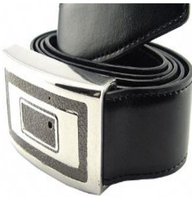
كاميرا دقيقة في حزام البنطلون