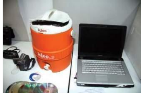
كاميرا داخل ثلاجة - مترا - ماء