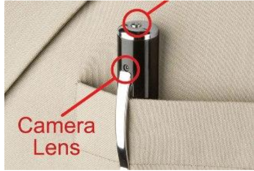
كاميرا فيديو في قلم تجسس