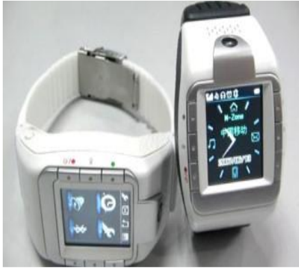
كاميرا دقيقة في ساعة يد موضوعة جانبا-شكل (4)