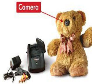
كاميرا تصوير داخل لعبة أطفال-شكل (5)

وهناك العديد من الأجهزة والأشياء التي تدخلها كاميرات التصوير للتجسس منها: (1)