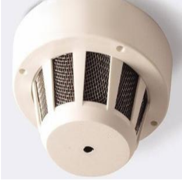
كاميرا داخل جهاز إنذار حريق-شكل (2)